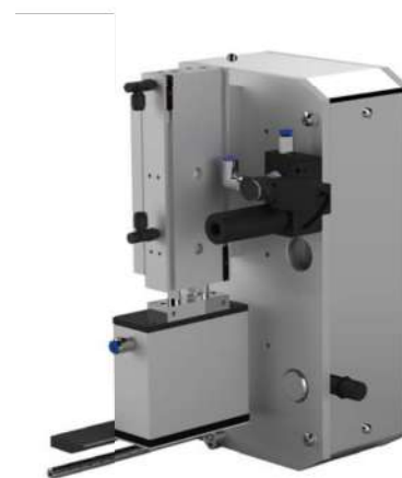
Anbaumodul mit Vakuumstempel